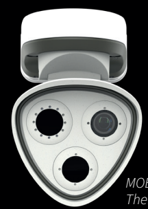
MOBOTIX M73 Thermal/TR