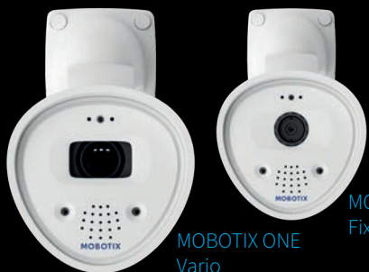
MOBOTIX ONE Vario